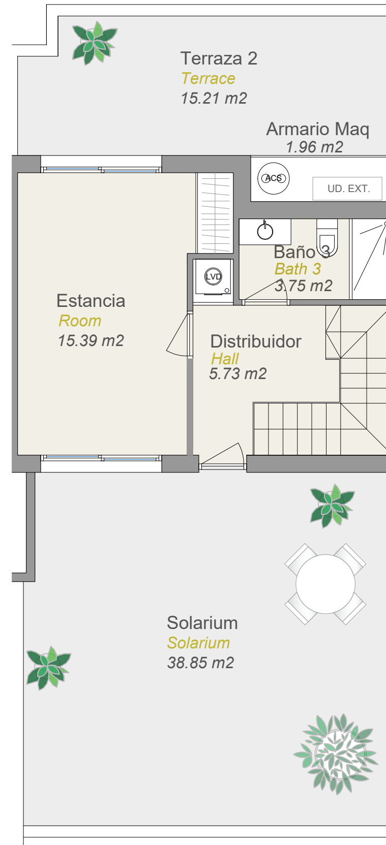
PLANTA BAJO CUBIERTA