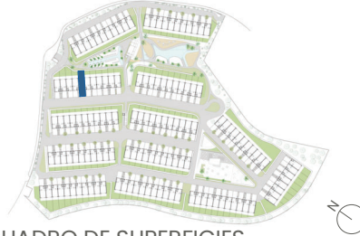
CUADRO DE SUPERFICIES