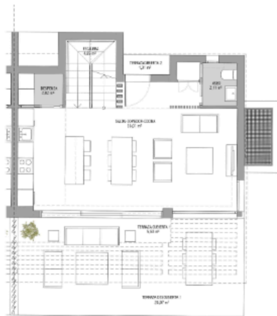
PLANTA BAJA 1:75