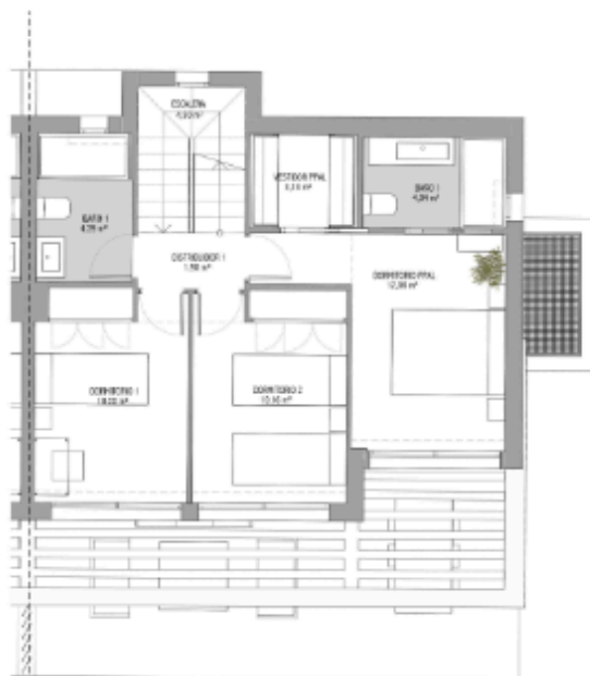
PLANTA ALTA 1:75