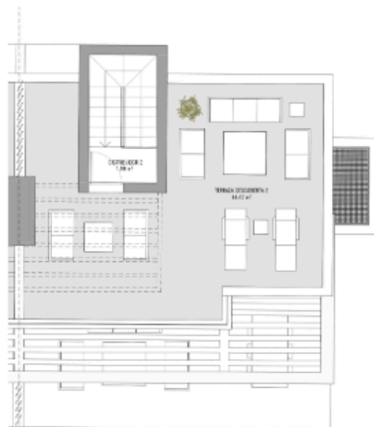
PLANTA SOLARIUM 1:75