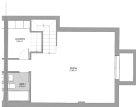
PLANTA SOTANO 1:75